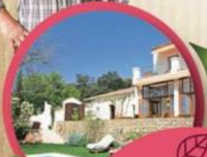
immagine puramente indicativa

VINCI UN WEEKEND DI RELAX NEL VERDE VIENI A TROVARCI! VEDI RETRO